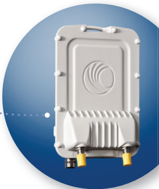
PTP 650 Conectorizado

Com nossas soluções de conectividade e backhaul PTP 650 de alta velocidade, confiáveis e seguras, você pode se comunicar independentemente dos obstáculos no caminho, do clima e das distâncias. Assim, você pode manter-se conectado com as pessoas, as informações e os lugares necessários para alcançar seus objetivos de comunicação de hoje e de amanhã. Ao mesmo tempo, nossos preços competitivos permitem que você obtenha o maior retorno sobre o investimento.