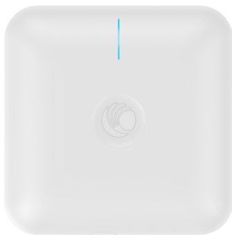
cnPilot e410 Enterprise Indoor Access Point

Intégrant un portail captif gérant les accès au réseau sans fil, la plate-forme permet notamment à Buffalo Grill de définir les étapes du parcours utilisateur, la page d'identification, le questionnaire de satisfaction, etc. lors de chaque connexion. Elle permet aussi d'établir des statistiques sur le volume de trafic et le profil de la clientèle (âge, genre, pays d'origine, etc.).